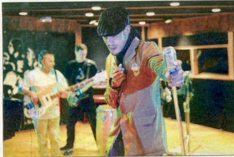
Un mélange de rythmes caribéens, de jazz, de funk et de soul au programme du Trabendo ce soir.